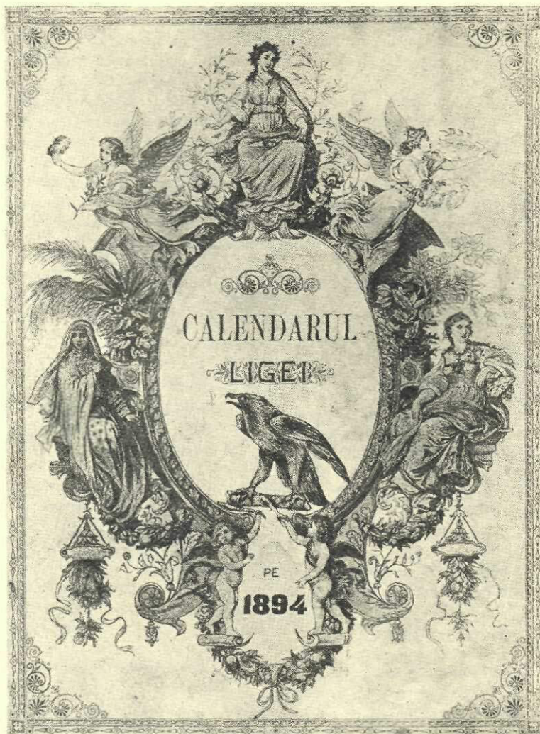
Coperta calendarului Ligii pe 1894

O bibliografie completă a tipăriturilor Ligii e aproape imposibil a se face, mai ales că de cele mai multe ori se tipăreau diferite volume fără a avea vre-o dovadă că sunt tipărite de Ligă. Vom da mai jos pe cele mai însemnate.