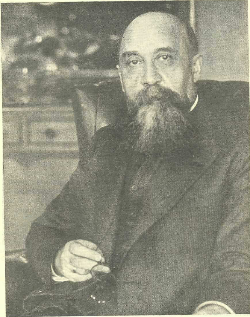
Președintele „Ligii pentru unitatea culturală a tuturor Românilor”

Anul 1896, deși an de neînțelegeri trecătoare, se evidențiază prin realizarea celui dintâi periodic al Ligii: „Liga Română”, apărând în tot decursul anului ca ziar, pentruca în 1897 să se transforme în revistă.