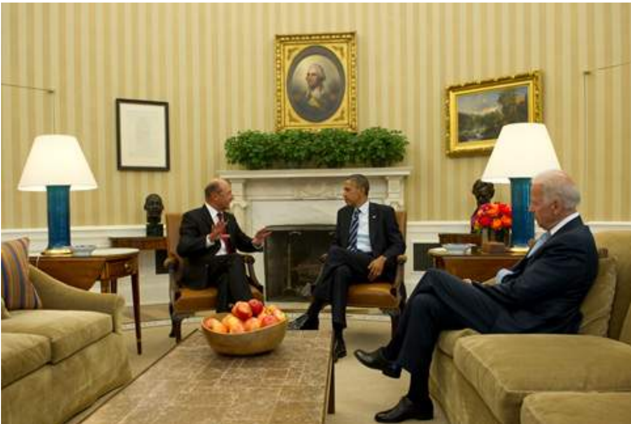
Imaginea 9. Președinții Barack Obama și Traian Băsescu, împreună cu vicepreședintele Joe Biden la Casa Albă, 13 septembrie 2011

Anii care au urmat au demonstrat transformarea acestei abordări pragmatice în realitate. Statele Unite au susținut România în domenii esențiale precum securitatea, cooperarea regională, dezvoltarea economică și reformele democratice. România, la rândul său, s-a dovedit un aliat stabil