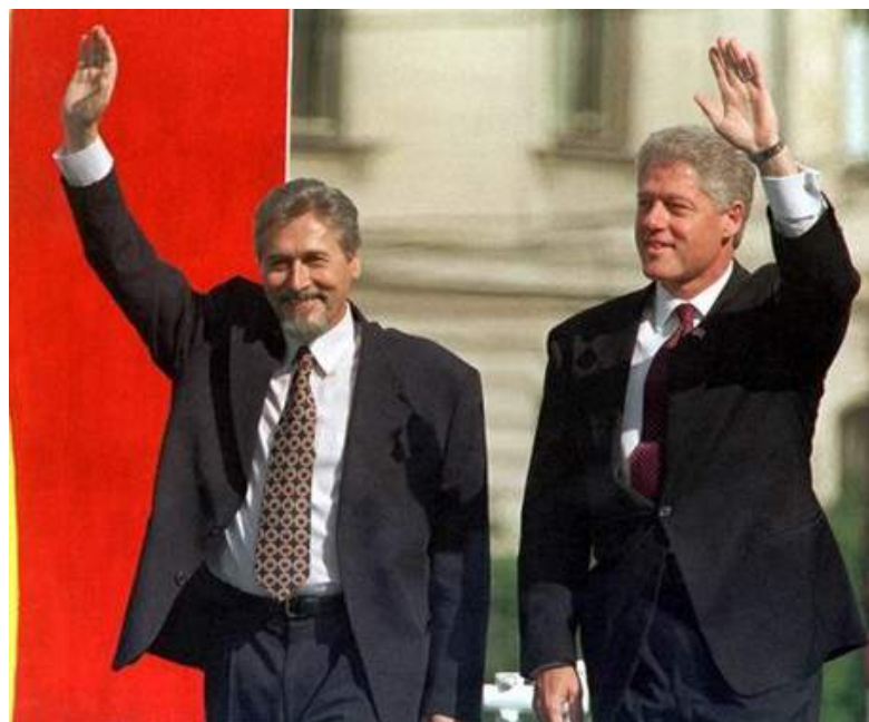
Imaginea 7. Președinții Bill Clinton și Emil Constantinescu la București, 11 iunie 1997

Aceste valori și interese comune și-au găsit expresia instituțională în actualul Parteneriat Strategic dintre Statele Unite și România. Parteneriatul, inițiat în 1997, cuprinde un cadru extins de colaborare între cele două națiuni, de la securitate și apărare, comerț și economie, până la relațiile culturale și interpersonale. Succesul său este dovedit nu numai prin longevitatea sa, ci și prin vitalitate, creșterea exponențială și rezultatele substanțiale. Pentru România, acestea au inclus aderarea la NATO, dezvoltarea unei economii de piață vibrante și angajamentul întregii societăți în sprijinul valorilor și principiilor