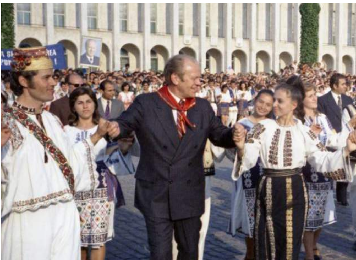
Imaginea 6. Președintele Gerald Ford în România, 2 august 1975