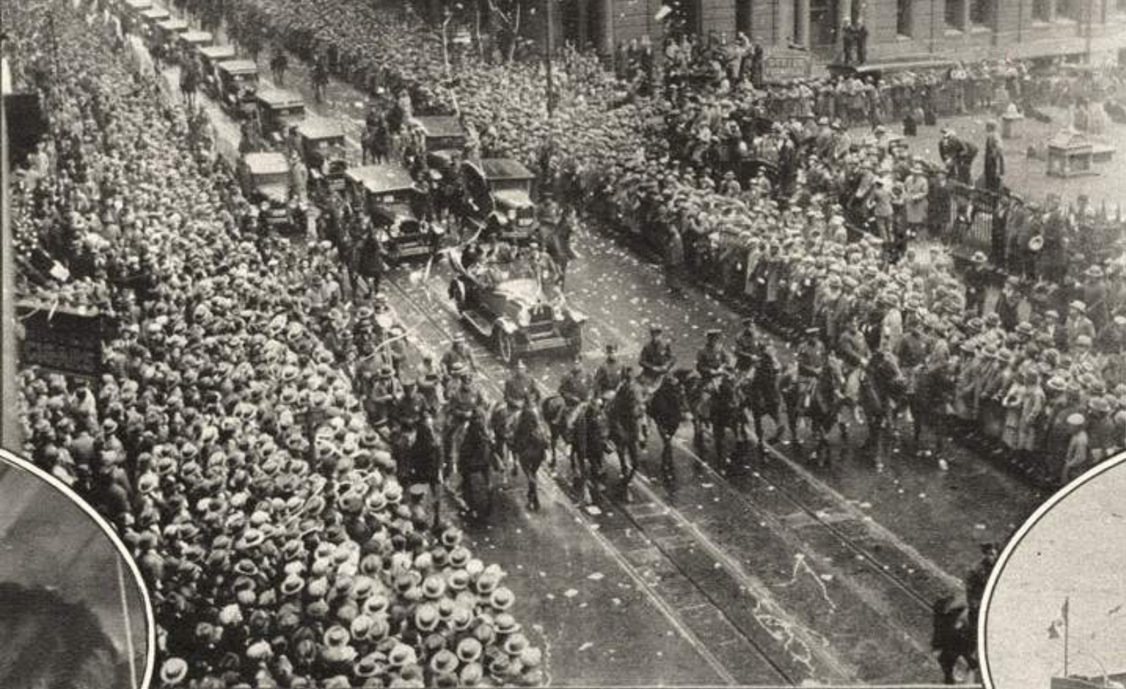
Imaginea 3. Regina Maria a României pe Broadway, New York, octombrie 1926

care a inclus o paradă spectaculoasă ținută la New York (Imaginea 3). Cu această ocazie, în mesajul adresat poporului american, regina și-a exprimat recunoștința pentru sprijinul primit: "În toate colțurile Americii există oameni care mi-au ajutat țara. Vreau să le strâng mâna, să îi privesc în ochi și să le spun din toată inima cât de recunoscători le suntem pentru sacrificiile lor" [13].