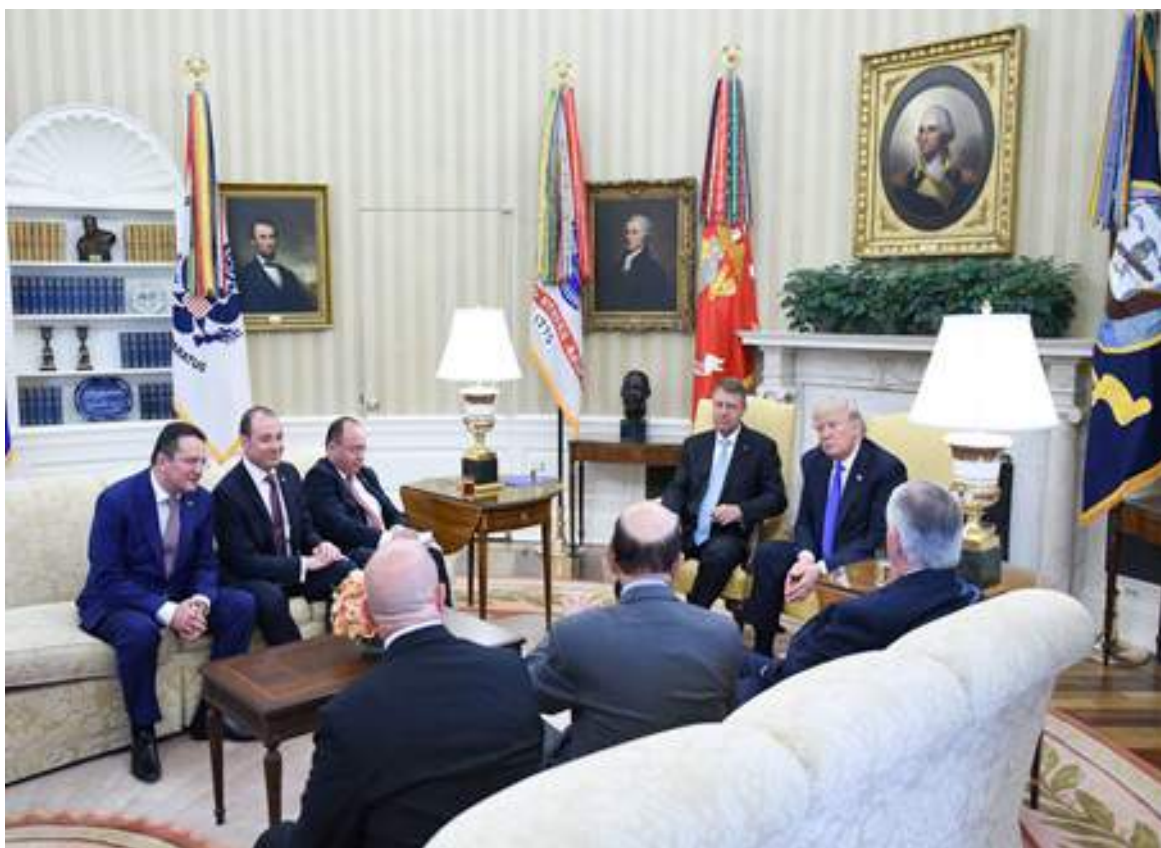
Imaginea 10. Președinții Donald Trump și Klaus Iohannis la Casa Albă, 9 iunie 2017

Voința politică a celor două națiuni, exprimată la cel mai înalt nivel, a impulsionat de-a lungul anilor o cooperare pragmatică. Dialogul Strategic anual se axează pe explorarea ideilor și a proiectelor concrete, în conformitate cu cadrul politic stabilit în Declarația comună privind Parteneriatul Strategic. Dimensiunile de securitate și apărare au constituit baza acestui dialog și cooperare și s-au dezvoltat în mod coerent și constant, sistematizat în documente legale. Acordul de cooperare în domeniul apărării din 2005 a oferit cadrul pentru consolidarea securității și stabilității României, dar și a întregii regiuni, prin amplificarea cooperării forțelor armate ale ambelor țări. Acest lucru s-a