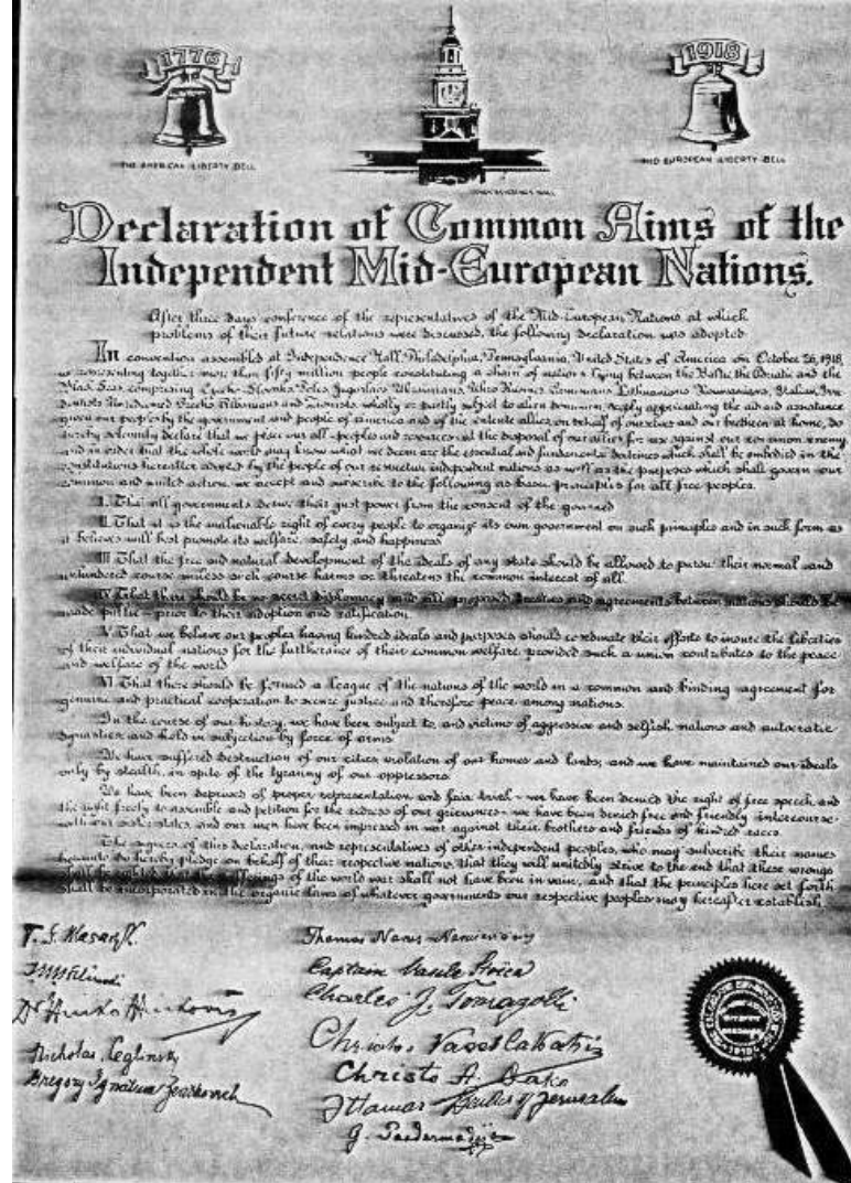
Imaginea 2: Declarația Obiectivelor Comune ale Națiunilor Independente Medio-Europene, semnată la Philadelphia pe 26 octombrie 1918