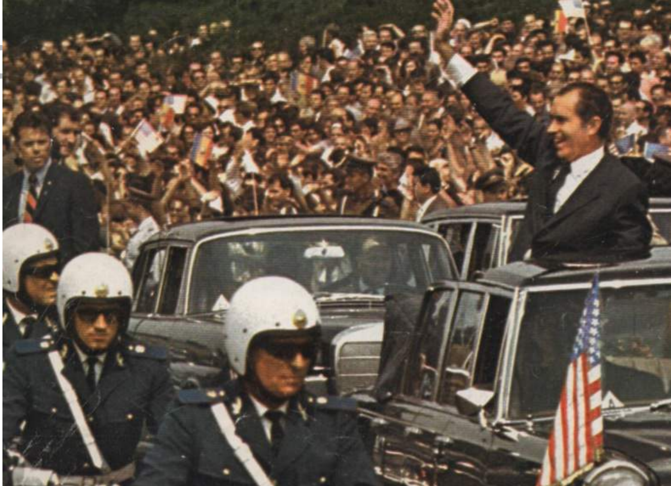
Imaginea 5. Președintele Richard Nixon în România, 2 august 1969