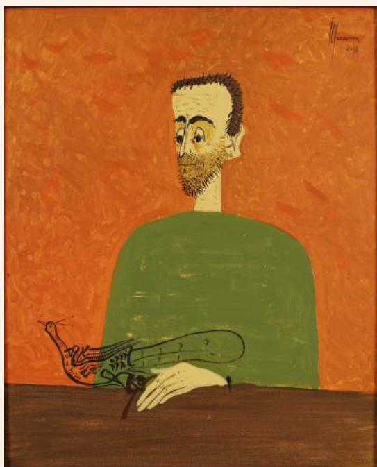
Coperta și ilustrația de număr: lucrări ale artistului Sorin Ilfoveanu

Festivalul de proză Augustin Buzura / Etapă înscrierilor / pag. 108 / Documentele Augustin Buzura / Victor Felea despre „Bloc notes” / Cronică literară, „Tribuna”, 1982 / pag. 110 / Concursurile Fundației Culturale Augustin Buzura / pag. 114 /