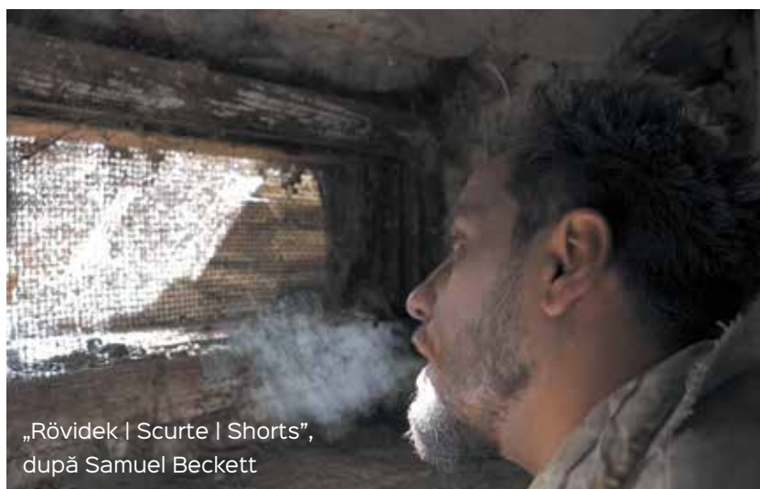
„Rövidek | Scurte | Shorts”, după Samuel Beckett

Văd mai degrabă această perioadă ca pe una de tranziție spre următoare inovații notabile. Trendul din 2021 îl continuă pe cel din 2020, ca răspuns la provocările impuse de pandemie. De aceea, în condițiile în care multe producții care au avut premiera în 2020 s-au jucat o singură dată cu public