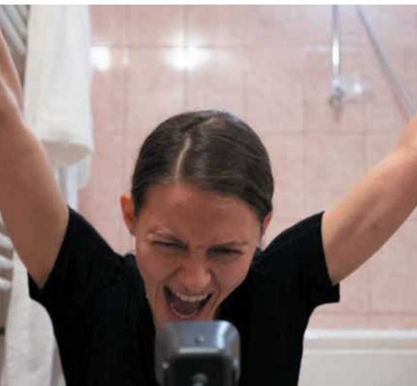
„Very Isolated Person”, foto: Ovidiu Zimcea. Via B-Critici.ro

și apoi doar de câteva ori în 2021, am să tratez cei doi ani împreună. Spectacolele cu decor opulent fac din ce în ce mai mult loc celor minimaliste. Cu excepții care se pot număra pe degete, teatrul de artă aproape a dispărut. Mai mult decât evident este că se schimbă generațiile în teatru. Creatorii tineri propun un alt fel de a face teatru, cu alte zone de interes, cu mijloace minimaliste, dar cu o apetență mult mai mare pentru diversitatea de new media. La început, a fost un efort de adaptare la producțiile menite difuzării online. Brusc, au apărut multe efecte video (unele preluate chiar din tehnicile de