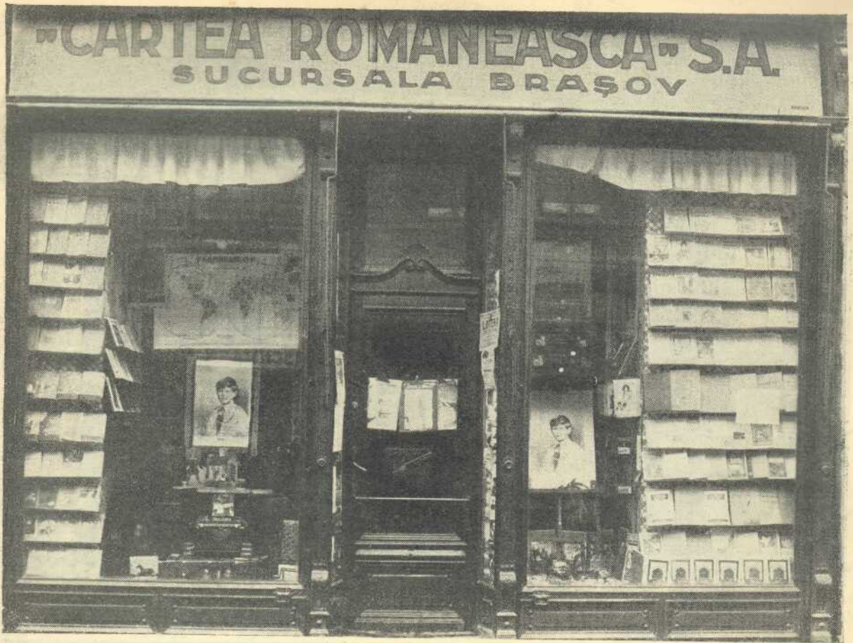
Librăria „Cartea Românească” din Braşov