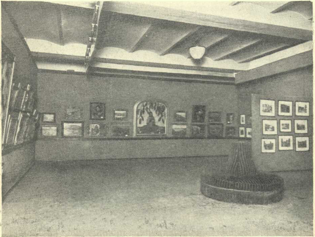
Sala de expoziții „Ileana”

Ținând seamă de importanța pe care o poate avea o librărie, în promovarea culturii naționale din provinciile alipite, „Cartea Românească” a socotit că îndeplinește o datorie către neam, înființând