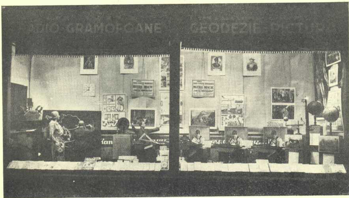
Vitrina didactică a librăriei din București

Ca o încununare a activității sale editoriale de un deceniu, „Cartea Românească” a întreprins publicarea unei opere mărețe, unice în România.