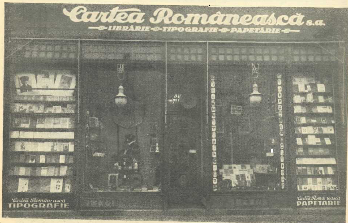
Librăria „Cartea Românească” din Timișoara