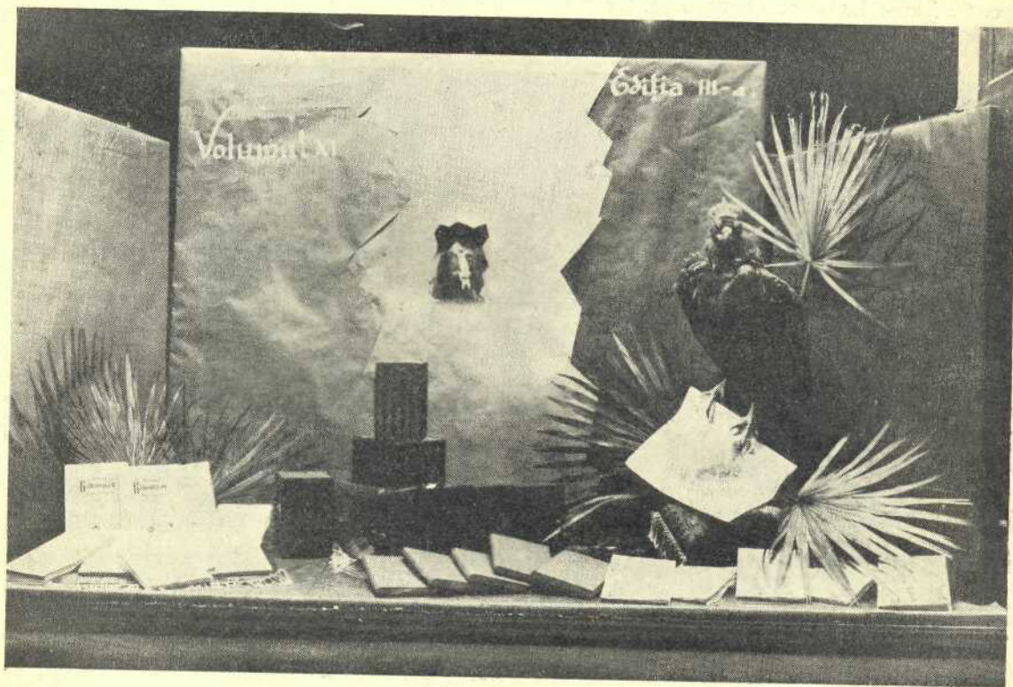
Vitrina A. D. Xenopol

Catalogul ei general cuprinde capitolele cele mai variate, dela poezii la opere de specialitate științifică, dela cărți cu preț redus la adevărate lucrări de artă pentru bibliofili. Din această din urmă categorie merită mențiune : Adrian Maniu, La gravure sur bois en Roumanie , frumoasele colecții de stampe