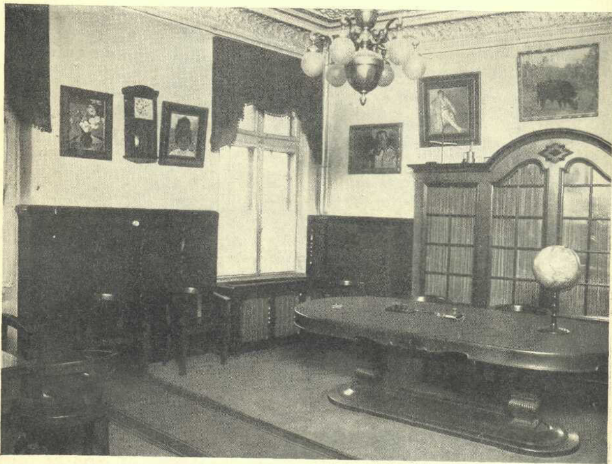
Sala de ședințe a „Consiliului”

Atelierele la început erau și ele răslețite, în diferite părți ale orașului, ceea ce însemna o mare pierdere pentru activitatea Societății. Inconvenientul fu îndepărtat din 1922, când s'a ridicat pentru atelierele industriale, o masivă clădire de beton armat, pe terenul cu o suprafață de 6.000 m. p. din Șos. Bonaparte 58—60. În acest chip Societatea „Cartea Românească” a înzestrat capitala țării cu o industrie înfloritoare, cea mai mare în ramura indus-