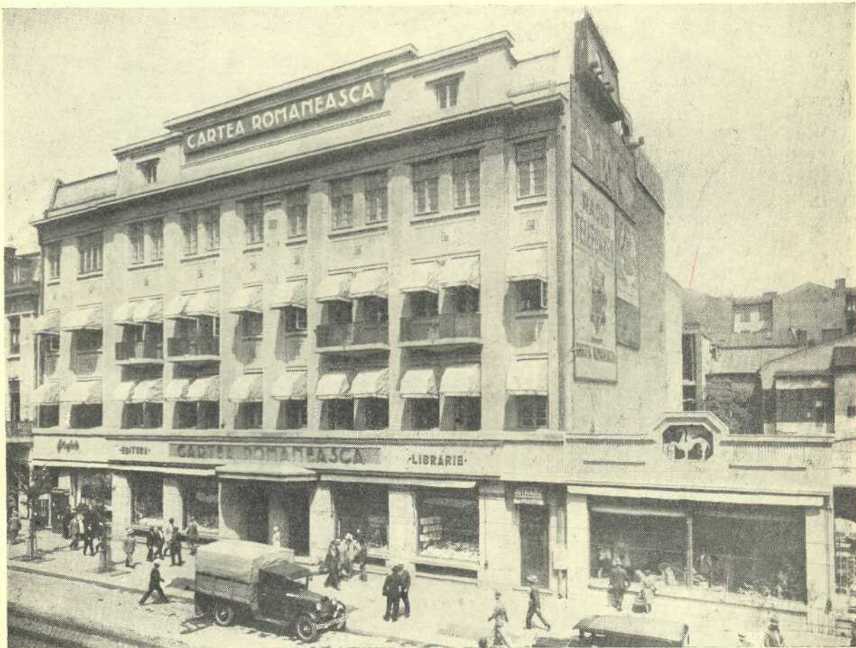
Librăria și biourile „Cărtămânești”