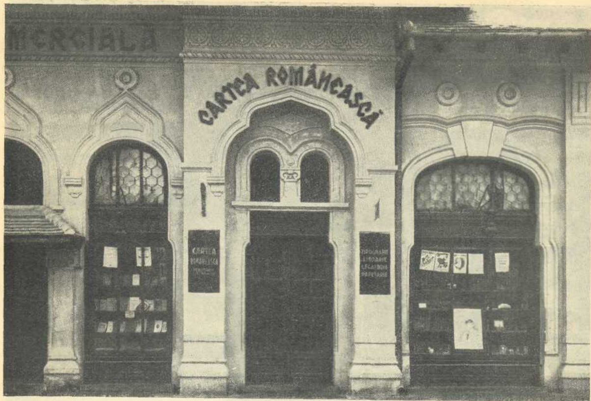
Librăria „Cartea Românească” din Dicio Sănmărtin