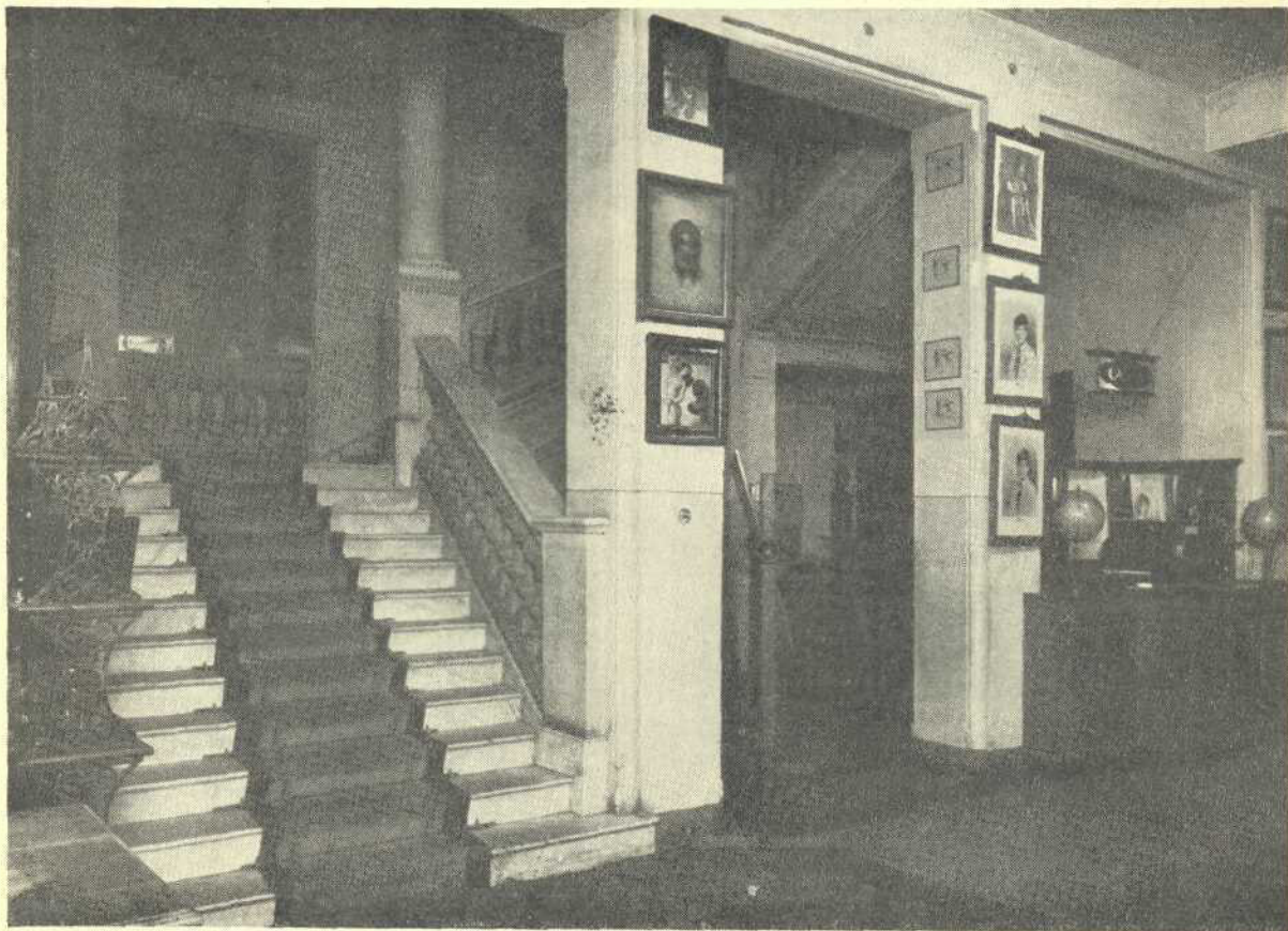
Scara de marmoră

La sfârșitul acestor pagini s'au dat câteva modele de imprimări făcute în Atelierele „Cărții Românești” după metoda tipografică, litografică și fotografică. Dar numai un cunoscător în arta grafică își poate da seama de ce poate produce un