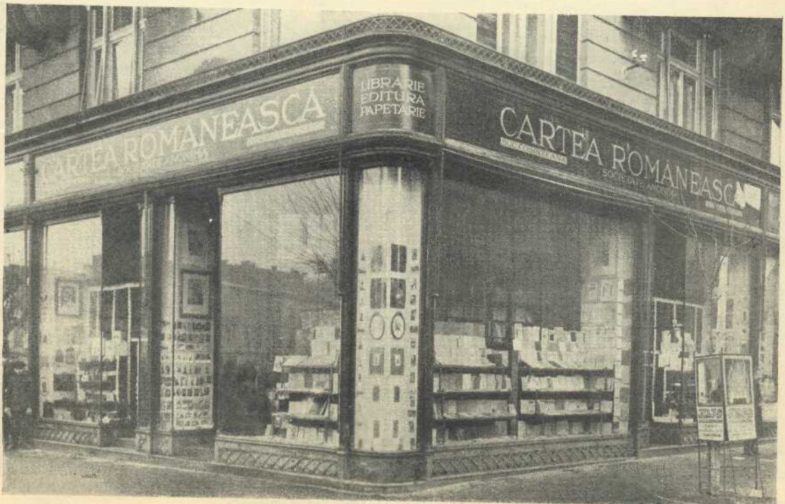
Librăria „Cartea Românească” din Cluj.