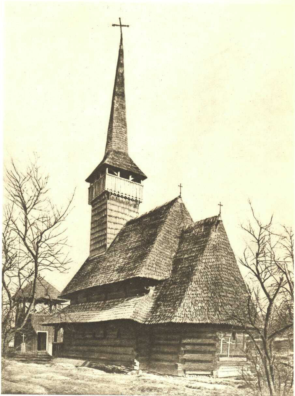
Biserica Rozavleajud. Maramureș, (1718)

Fotogravură „Cartea Românească” pentru BOABIȚE GRÂU.