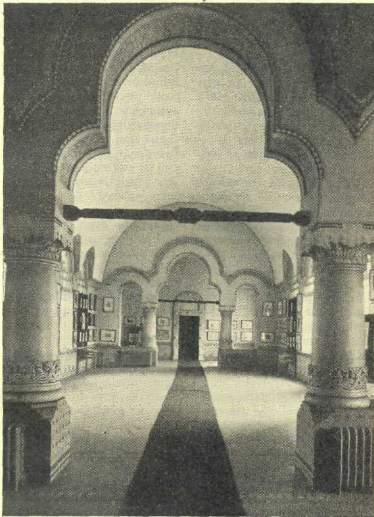
Muzeul : salado expoziția stampelor

Cu prilejul Războiului pentru întregirea neamului (1916-3918) Arhivele Statului au suferit o pierdere foarte mare : toate actele și documentele anterioare veacului al XVIII-lea, cum și condicile și manuscrisurile mai de valoare încărcate în 30 de lăzi mari, au fost evacuate în Rusia, de unde nu s'au înapoiat nici până astăzi. A fost cea mai grea pierdere pe care au suferit-o vreodată arhivele noastre. În schimb materialul rămas în depozite a fost păzit de Onciul, în tot cursul ocupației dușmane, cu toată grija și cu toată