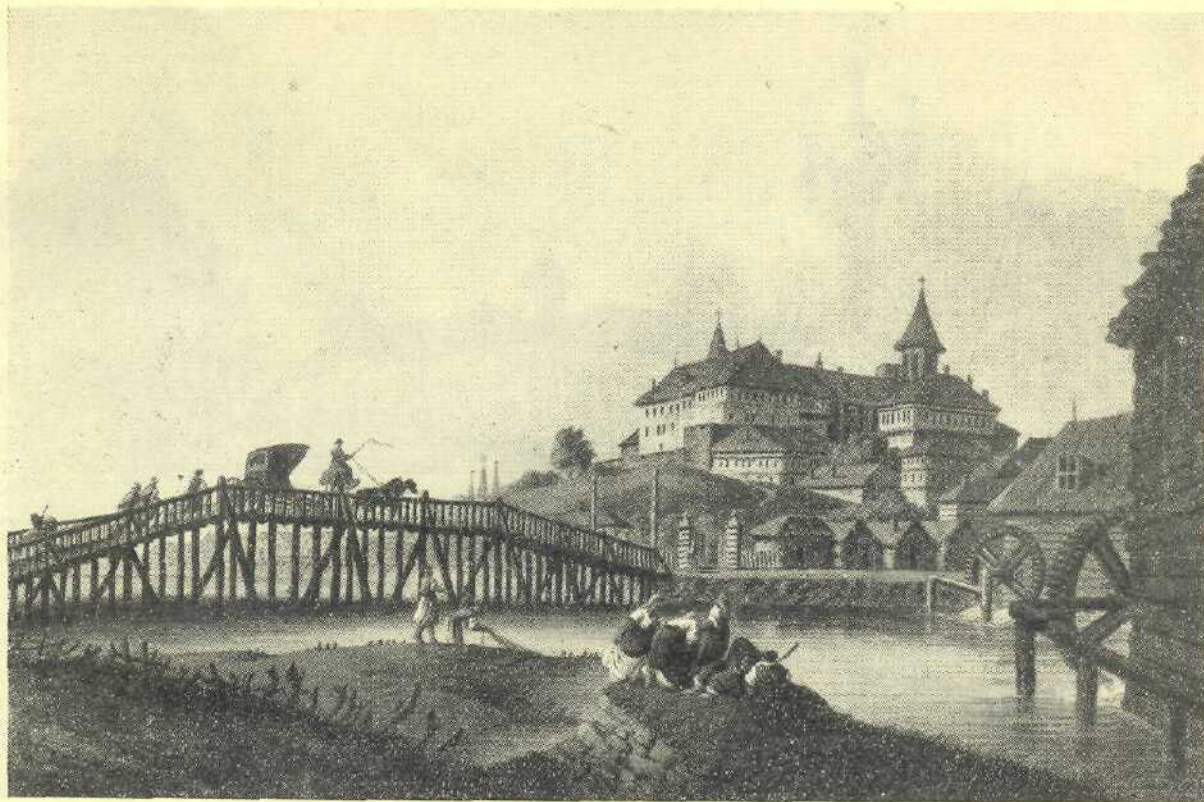
Mănăstirea Mihail Vodă la începutul

trecut (locuiliul al Arhivelor Statului)