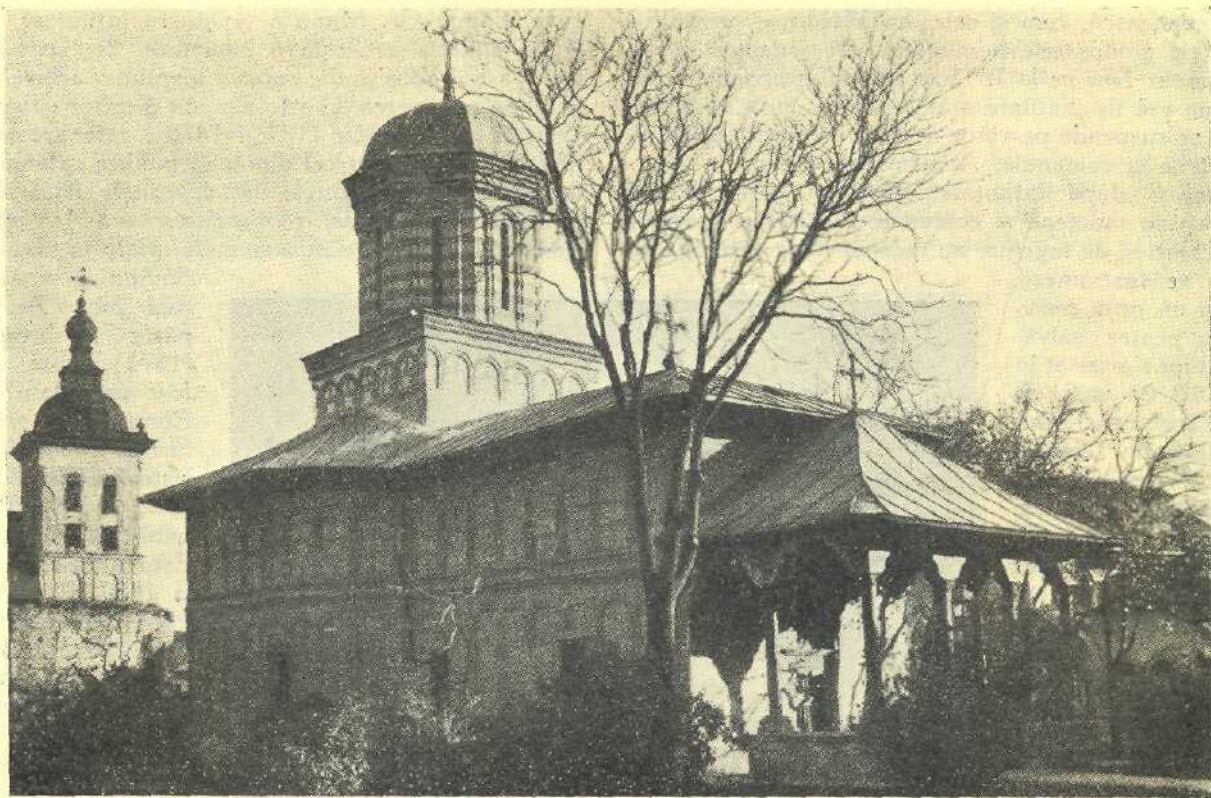
Biserica Mihail Vodă, din curtea Arhivelor Statului cloșchea

și vechile depozite de documente istorice, ce se păstrasera până atunci separat la cele două mitropolii și totodată și cea mai mare parte din arhivele mănăstirești.