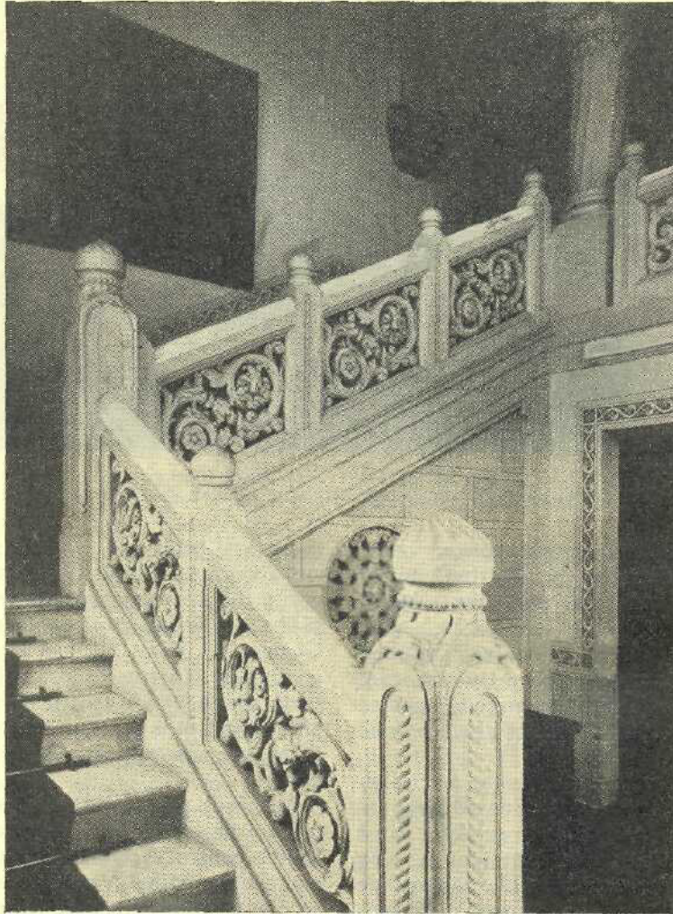
Scara dela Muzeul Arhivelor Statului

Dar interesele instituției nu le-a susținut cu tot devotamentul ce-l merita învățatul care făcea atât de des apel la probele documentare în lucrările sale științifice, ținea arhivele închise pentru alții. Localul, care nu fusese decât în parte reparat la 1866, începuse a se deteriora complect și distinsul savant, aproape totdeauna în conflict cu autoritățile superioare, nu putu obține fondurile