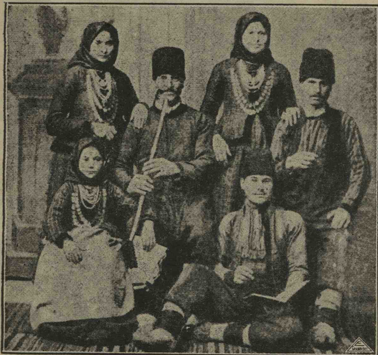
O familie găgăuză din comuna Bașalma, jud. Tighina.