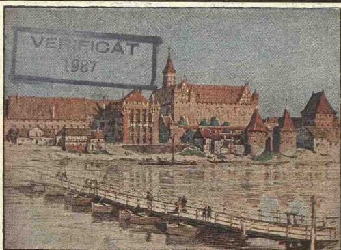
A. Bendrat: Die Marienburg

„... Doch wird man auch aus dieser nur einen beschränkten Teil der vorhandenen Bilder unjaffenden Aufzählung den Reichtum des Dargebotenen erkennen. Indessen es genügt nicht, daß die Bilder da sind, sie müssen auch gekauft werden. Sie müssen vor allen Dingen an die richtige Stelle gebracht werden. Für öffentliche Gebäude und Schulen sollte das nicht schwer halten. Wenn Lehrer und Geistliche wollen, werden sie die Mittel für einige solche Bilder schon überwiesen bekommen. Dann sollte man sich vor allen Dingen in privaten Kreisen solche Bilder als willkommene Geschenke zu Weihnachten, zu Geburtstagen, Hochzeitsfesten und allen derartigen Gelegenheiten merken. Eine derartige große Lithographie in den dazu vorrätigen Künstlerrahmungen ist ein Geschenk, das auch den verwöhntesten Geschmack befriedigt. An den kleinen Blättern erhält man für eine Ausgabe, die auch dem bescheidensten Geldbeutel erschwinglich ist, ein dauernd wertvolles Geschenk.“ (Türmer-Jahrbuch.)