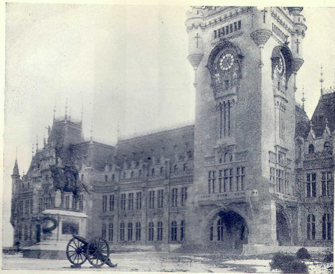
Piața Palatului Administrativ din Iași