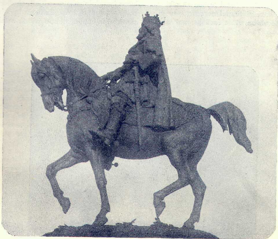
Ștefan cel Mare