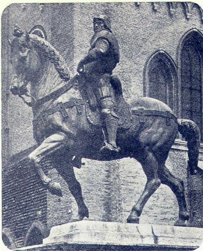
Colleone de Verrocchio, din Veneția

Frémiet era mai mult un sculptor animalier. De aceea și calul statuii este făcut cu tot meșteșugul și cunoștințele pe care le comportă această artă. Pasul liniștit și mersul triumfal, al calului, precum