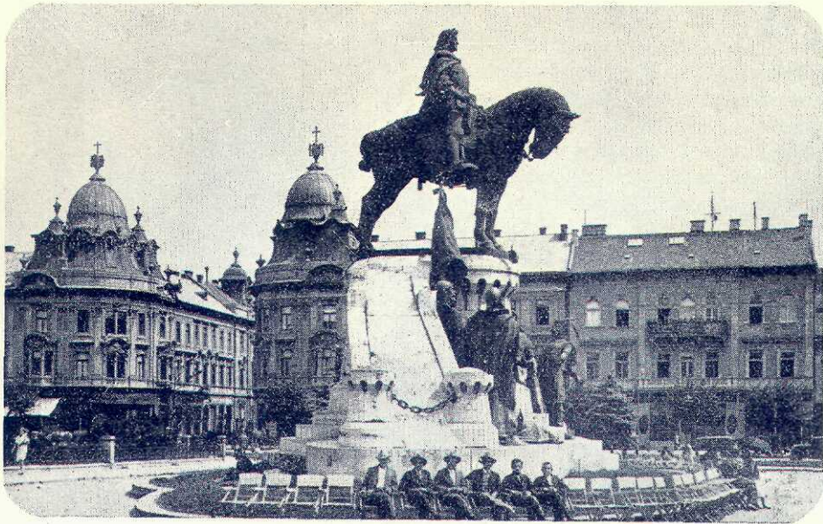
Matei Corvinul în Piața Unirii din Cluj

tuturor monumentelor, este o chestiune de dezvoltare în timpul execuției. Cine crede că după o machetă cât pumnul poate să prevadă statuia în complexul ei se înșală. Aci mai mult decât ori și unde este vorba de artistul cu puteri de realizare care va ști să isprăvească o statuie lucrând la ea multă vreme și văzând și făcând precum și făcând și văzând. Statuia în platură și înainte de turnarea în bronz trebuie văzută la locul ei. Nici o grabă nu este admisă. Artistul trebuie să aibă posibilitatea de căutare și timpul necesar.