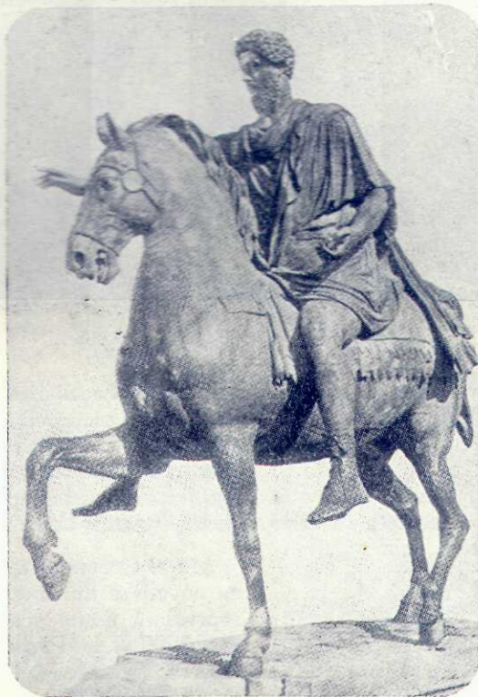
Marcu Aureliu dela Capitol

Această statuie echeștră este, în primul rând, un portret. Picioarul dinainte al calului, care este ridicat, pare puțin desmembrat. Dar felul în care statuia este executată, arată că artistul care a făcut-o, era un artist desăvârșit și un mare meșteșugar, care știa să intre în amănunt, cu o disciplină admirabilă. Greutatea realizării acestei statui echestre, sau mai degrabă, meșteșugul neobișnuit, este cu siguranță turnatul acestui bronz aurit. Căci o statuie echeștră este foarte greu de realizat, atât ca execuție sculpturală, cât și ca tehnică de turnătorie în bronz. Statuetele echestre cu adevărat frumoase din toate timpurile sunt puține. Aceasta fiindcă i se cer artistului multe cunoștințe asupra omului și animalului și, pe lângă acestea, un simț precis al monumentalității unui echeștru. Astfel, dacă am începe cu Marcu Aureliu și mai departe cu Colleone