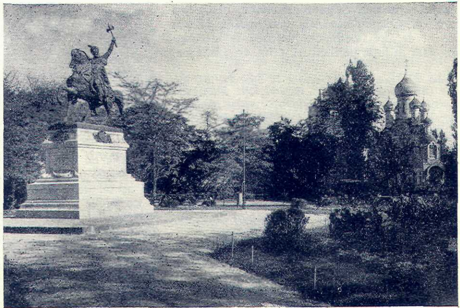
Piața Universității din București

Pentru o statuie ecestră un concurs între artiști nu poate hotărî nimic în ce privește reușita statuii. Infăptuirea unei statui eceștre, ca a mai tu-