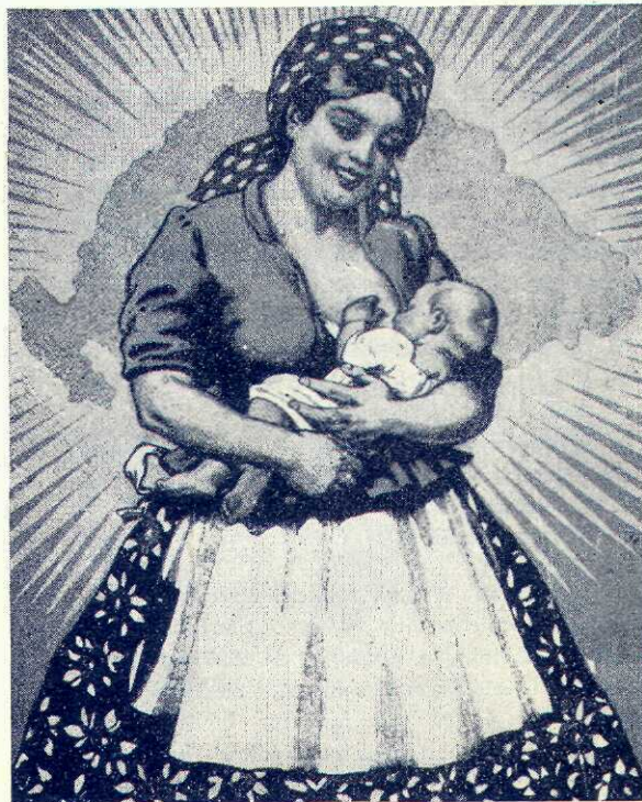
O mamă maghiară (cu Ungaria „mileneră” în spate!)

VI. INDRUMĂRI ȘI CONTROL. — Ministerul Ungar al Cultelor are un serviciu special denumit „Serviciul culturii în afară de școală”. Șeful acestuia, un consilier mi-