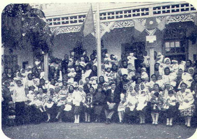
Clinica de copii din Breaza în 1928

b) Clădește o temelie sufletească pe fapte și nu pe vorbe.