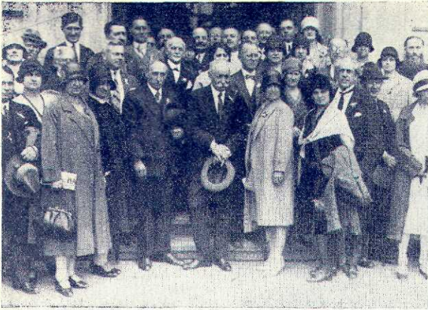
Congresul antialcoolic internațional org. de Casele Naționale în 1929