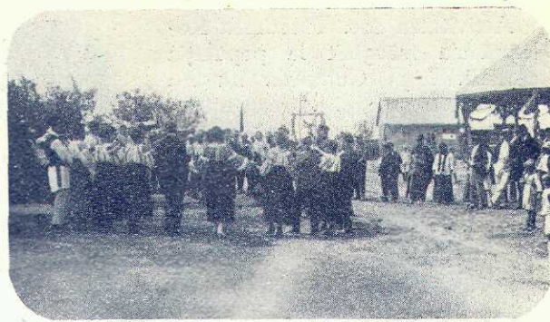
Intrecere de jocuri naționale

dar afiliate sau în colaborare cu Centrala.