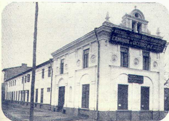
Întâiul cămin de ucenici din București, întemeiat de Casele Naționale

Sunt în țară vre-o 60 de Case Naționale, unele înființate de Centrală, altele din inițiativă locală,