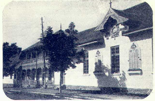
Clinica de copii din Breaza