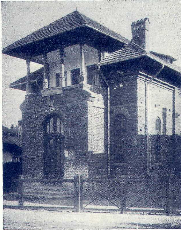
Casa Națională din Piatra Neamț