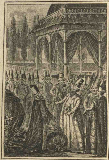
N. M. Queverdo Inv. Del