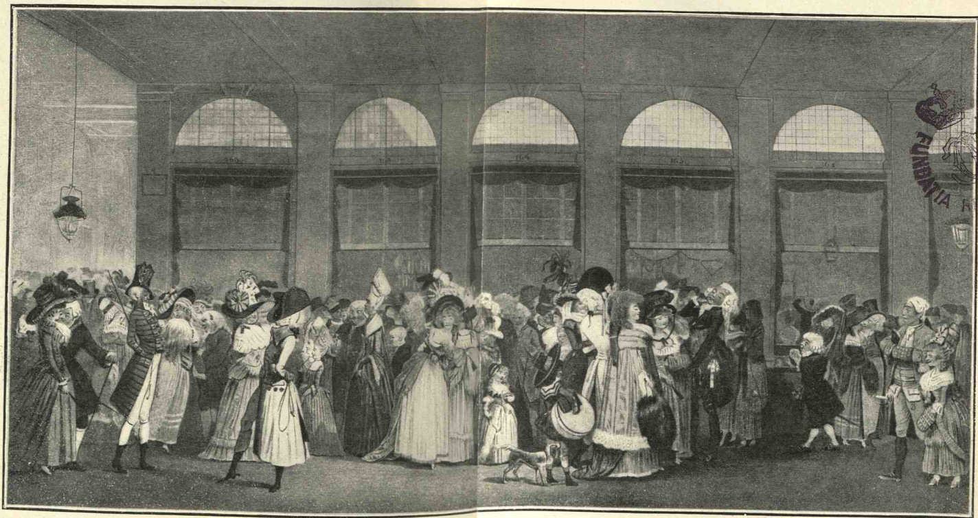
PROMENADE DE LA GALERIE DU PALAIS-ROYAL ( Camp des Tartares ) D'après une gravure en couleur de Debuourt (1787)