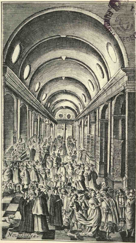
LES NOUVELLISTES DANS LA GALERIE DU PALAIS D'après une estampe du tome II des Nouvelles nouvelles de Donneau de Vizé (1663).